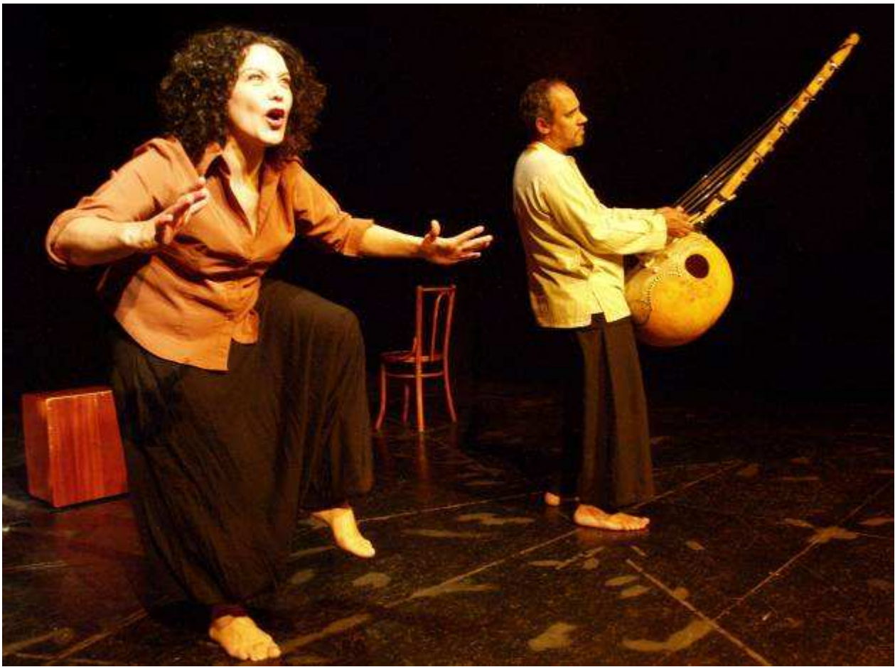
Au théâtre des Asphodèles (Lyon, septembre 2009)