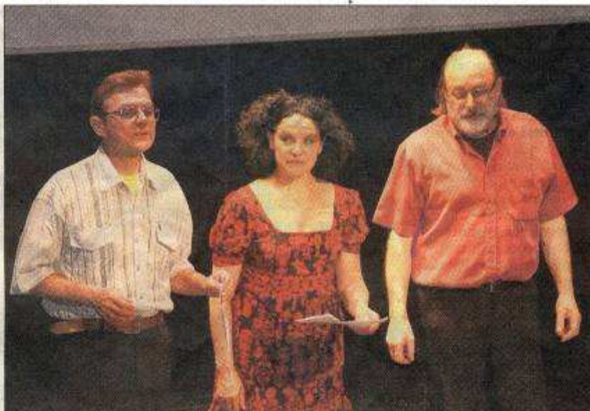
Les artistes éco-citoyens de la compagnie Paraboles marient dans un même terreau théâtre, poésie et environnement

La salle de l'Échappé avait revêtu ses plus beaux habits, samedi, pour accueillir l'association de protection de la nature qui fêtait les dix ans de son troc boutures. Sur la scène, trois artistes de la compagnie Paraboles ont parlé tout simplement de la planète terre. L'idée générale était de partir du paradis originel pour finir par un poème de Prévert sur la terre qui est bien malade... Des chants de Charles Trénet, d'Anne Sylvestre, ou encore des poèmes de Rimbaud et de Prévert. « Il faut être poli avec la planète », dit le poème. Les membres de l'APNQVS en sont bien conscients et essaient à leur niveau de faire bouger les choses.