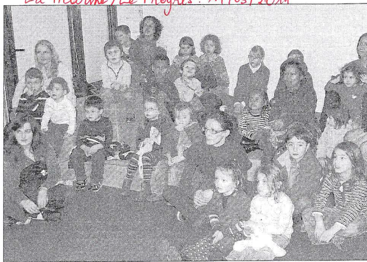
La médiathèque municipale est devenue la grande bibliothèque d'Alexandrie le temps d'une heure du conte