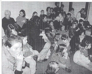
Un public familial s'est déplacé pour cette heure du conte.

Dans le cadre de la semaine internationale, la médiathèque de Monistrol a accueilli une conteuse pour un après-midi aux accents égyptiens.