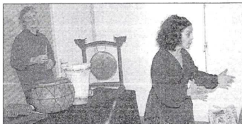
Les deux artistes ont offert un spectacle touchant et drôle que le jeune auditoire a apprécié

> Renseignements et contacts : 06 61 57 96 59. Internet : http://paraboles.cie.unblog.fr/